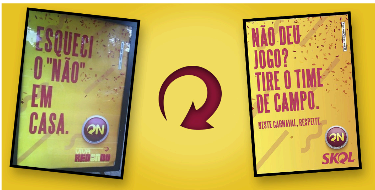
Figura 3 - Anúncios de Carnaval da Skol. Anunciante: Ambev.

Na prática, rapidamente a Skol substituiu o “Esqueci o não” por “não deu jogo? Tire o time de campo!” ou “Quando um não quer, o outro vai dançar”, seguido da assinatura: “Neste Carnaval, respeite”. Além disso, a cerveja passou a adotar um novo posicionamento de marca, prezando pelo respeito e diversidade, conforme se verá a seguir.